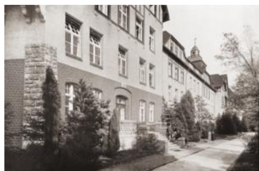
„Alpenhaus” w 1940 r. i w 2020 r.

W czasie I wojny światowej Beelitz-Heilstätten, pełnił też rolę szpitala wojskowego, w którym leczono i operowano zwożonych tu masowo rannych na frontach żołnierzy Armii Cesarstwa niemieckiego. Do 1919 r. przebywało ich tutaj ich łącznie kilkanaście tysięcy. Jednym z pacjentów był Adolf Hitler, którego pod koniec 1916 r. przywieziono z raną nogi. Stało to się nad Sommą, w czasie jednej z najkrwawszych bitew I wojny światowej.