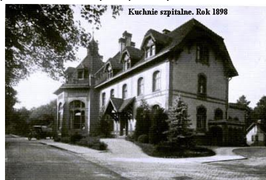
Kuchnie szpitalne. Rok 1898