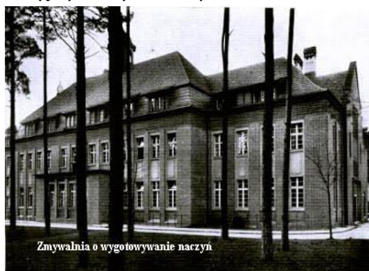
Zmywalnia o wygotowywanie naczyń